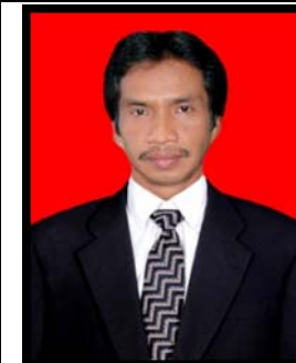
Drs. Syarkani Biro Administrasi Umum dan Keuangan (BAUK