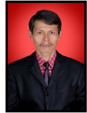
Drs. Yushamdi Pusat Komputer (PUSKOM)